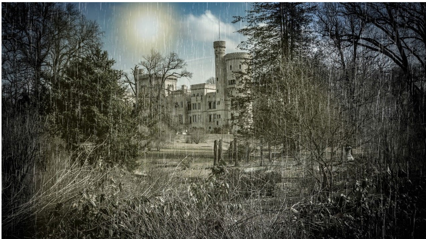
Le château de Babelsberg au sud ouest de Berlin

Sur place, Tauh'd , l'elfe à la peau sombre, multiplie les simagrées pour donner le change, mais laisse, en fin de compte, la vente être remportée par Kaschmir . La belle femme, dans sa trentaine, est la cheffe du clan Cezve du Kreuzbazar. Ayant repris les activités familiales (voir le jeu vidéo Dragonfalls), elle joue ici le rôle d'intermédiaire pour Lugosi. À l'issue de la vente aux enchères, protégée par des runners de confiance issus de son quartier, elle retourne dans le Kreuzbazar pour y rencontrer son employeur et lui remettre le carnet. De là, Bella Lugosi et son escorte remontent dans sa limousine et retournent à sa résidence, le château de Babelsberg. Le carnet rejoint sa collection personnelle et y reste jusqu'à la fin de l'aventure, à moins que les runners ne s'en emparent.