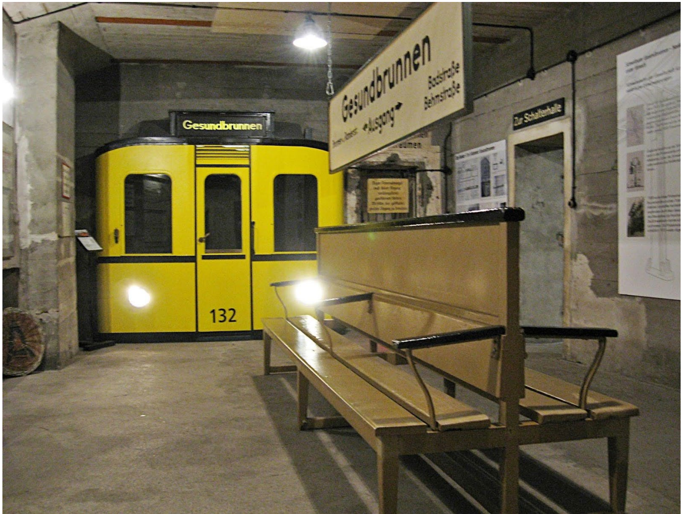
Les sous-sols de la station de Gesundbrunnen